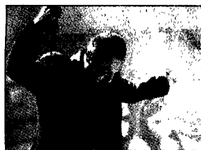
Gigi Finizio chiuderà la kermesse del mare